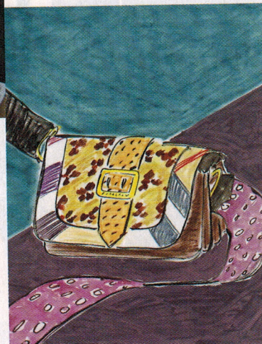
Une illustration de la campagne automne-hiver 2016 BURBERRY réalisée par Luke Edward Hall.

Le DESSIN est à l'origine de toutes les créations artistiques du Britannique.